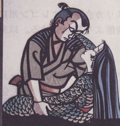
西山 三郎 作 「鯉によぼう」