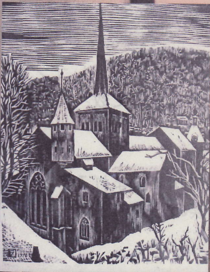
ピエール・オベール作 「冬のロマンモティエ」