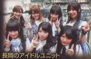
長岡のアイドルユニット Y.O.Y