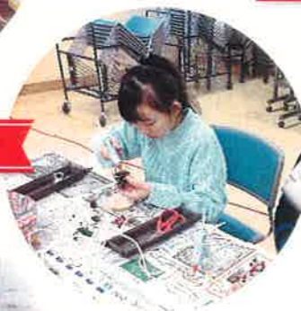
ホの家で小物作り