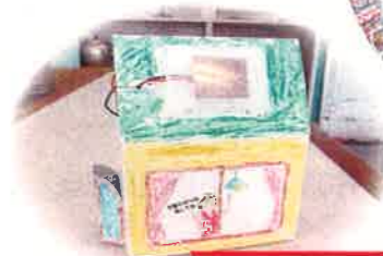
ソーラーハウスを作ろう