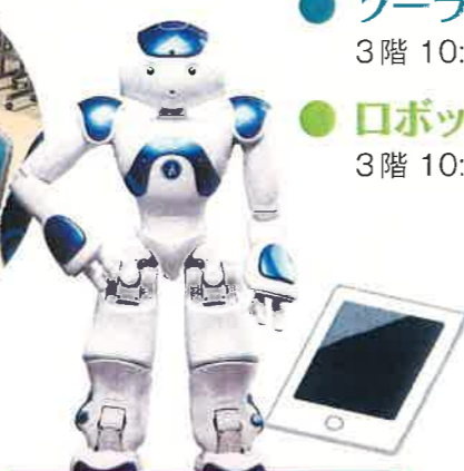
ロボットを動かしてみよう