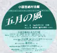
昭和63年 オープニングフェスティバル