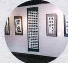
平成7年 俊山塾書道展