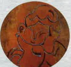
平成30年 木嘯さんへ展