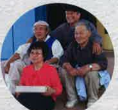
平成20年 大陸と島を結ぶ紙の絆展