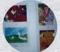
平成9年 小・中学生作品展