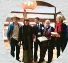
平成31年 ホルスト・ヤンセン「画狂・紙狂」展