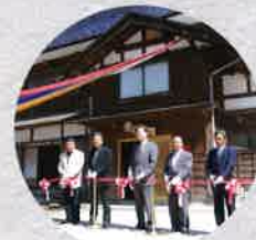
平成18年「復興記念事業」 ヒマラヤの紙の里から越後の紙の里へ展