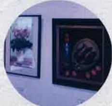
平成6年 漢美会作品展