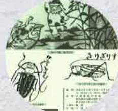
平成8年 小国・武蔵野 交流きりえ展