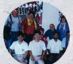
平成4年 アメリカ先住民「心の世界」展