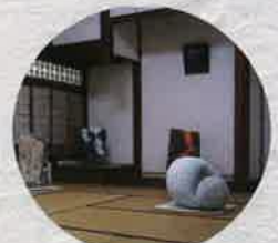
平成24年 悠・融・展