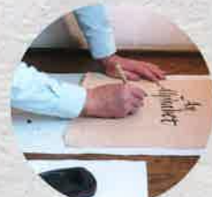
平成27年 アルファベットの風景展