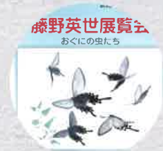
平成12年 藤野英世展 おくにの虫たち