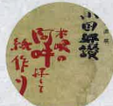
平成3年 小国郷讃展