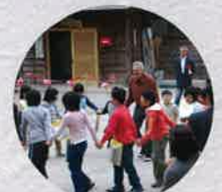
平成19年 リック・バルトー展