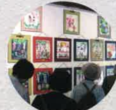
平成23年 地球と人を結ぶ交流展