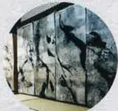
平成11年 山野田十年展