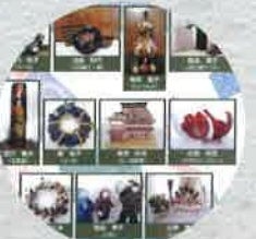
平成29年 小国郷匠の作品展