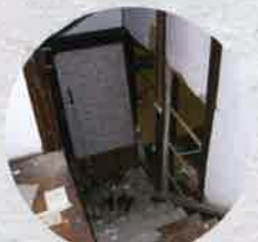
平成16年 10月23日 中越地震