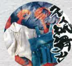
平成22年 衣人紙舞台展