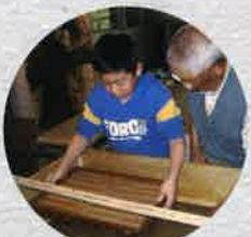
平成21年 山野田二十年展