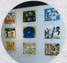
平成10年 小国町子ども作品展