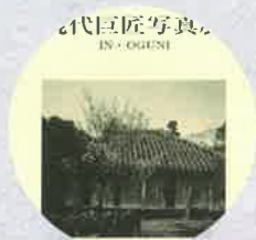
平成元年 現代巨匠写真展