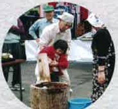
平成15年 小国芸術村まつり