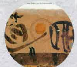
平成14年 ホルスト・ヤンセン展